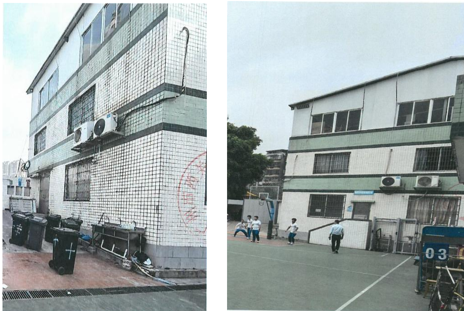
图 4、5 体艺楼三楼临建仓库未拆除前样貌

2. 体艺楼三楼的临建仓库，面积 324.07 平方米，为一层钢结构简易板房，外墙与斜屋面采用彩钢夹芯板搭设而成，外墙上铝合金推拉窗。