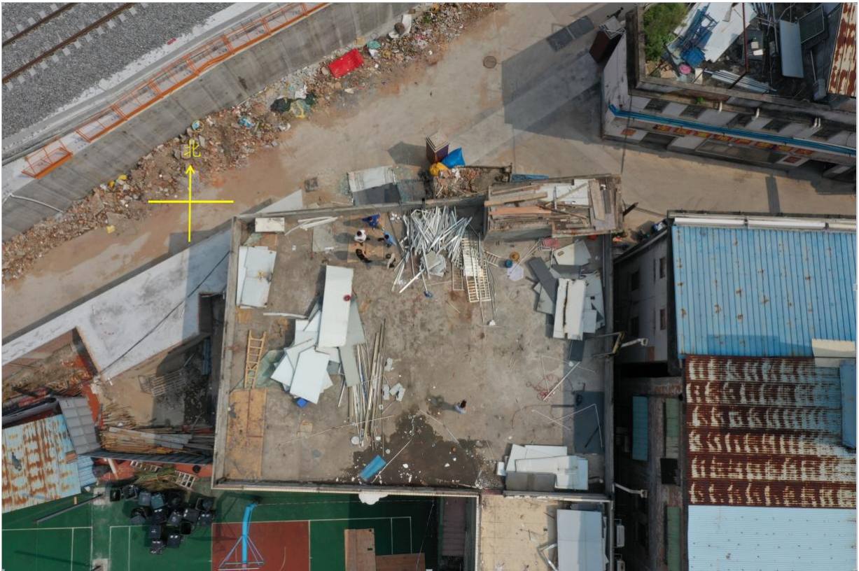
图1 事发体艺楼俯视图

1. 发生高处坠落事故的体艺楼为一栋建于1995年、结构层数为两层、建筑物高度（不含女儿墙）约为6.9m、总建筑面积约为496m 2 的钢筋混凝土结构建筑物。