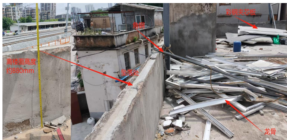
图 7 事发时三楼屋面情况

4. 根据现场目击工人指认，专家组找到工人张某伟发生坠落时所抛掷一根 \angle 50 角钢，测量确认角钢长度为 1600mm，角钢一端焊有约 30mm 长的短角钢，呈 7 字状，角钢重量约为 5kg。