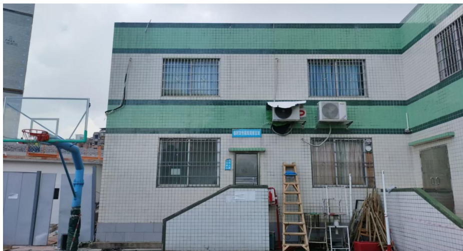
图 6 事发时体艺楼南立面

3. 事发时，三楼临建仓库的顶棚和围边已经拆除完成。三楼屋面有一圈女儿墙，高度为 880mm。