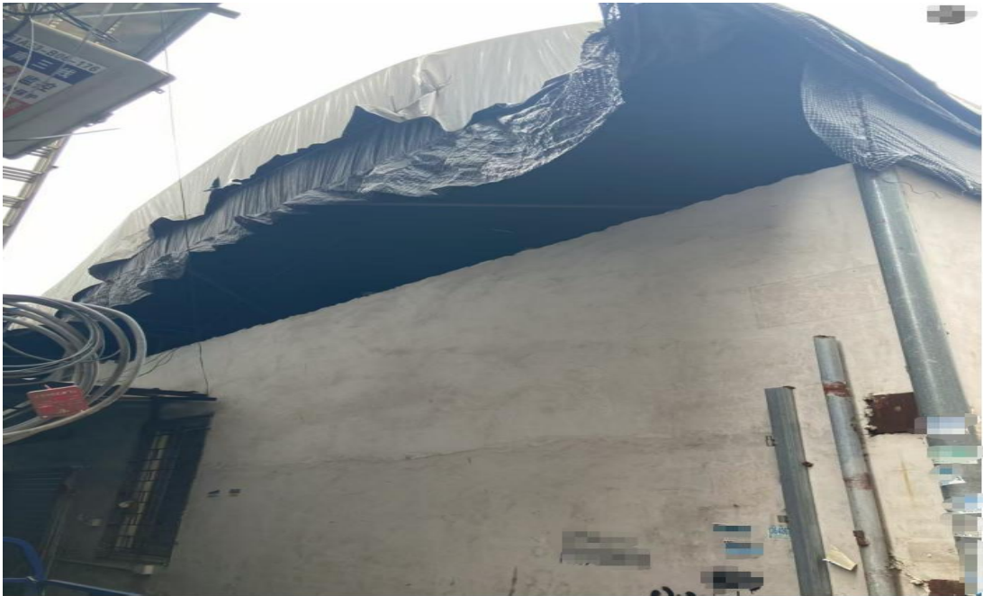
图 2 事发建筑左侧视图