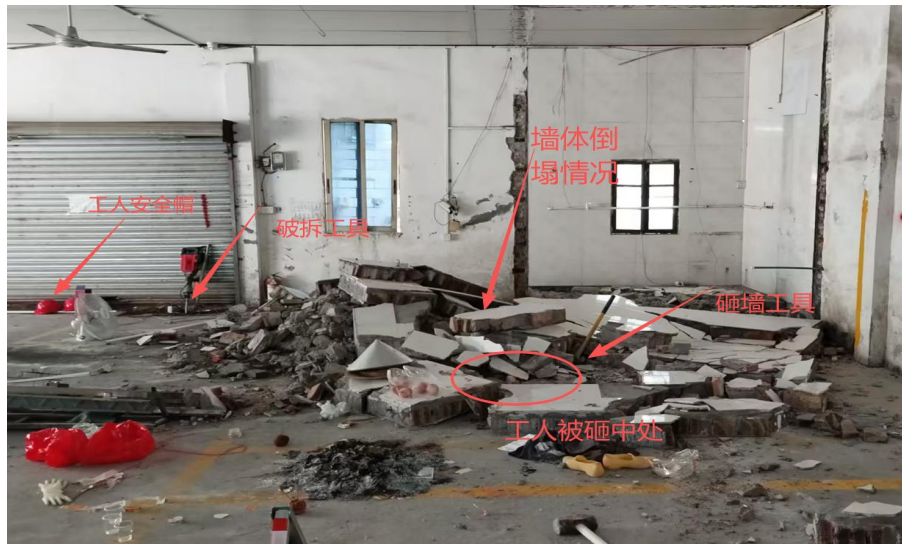
图 6 事发墙体倒塌情况图