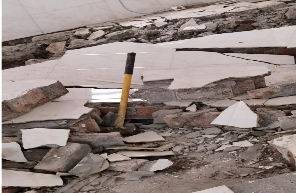
图7 事发时工人使用的砸墙工具

4. 事发时工人使用的砸墙工具是分体八角锤，锤子黄色手柄长80CM，手柄末端外套黑色防滑胶套。