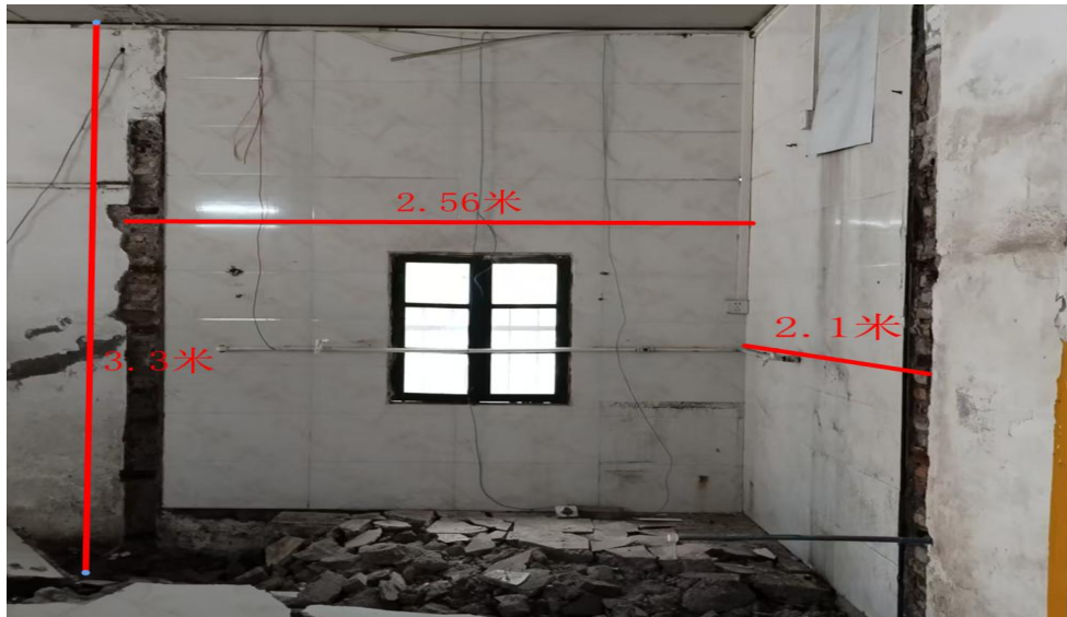
图 4 事发厨房情况图