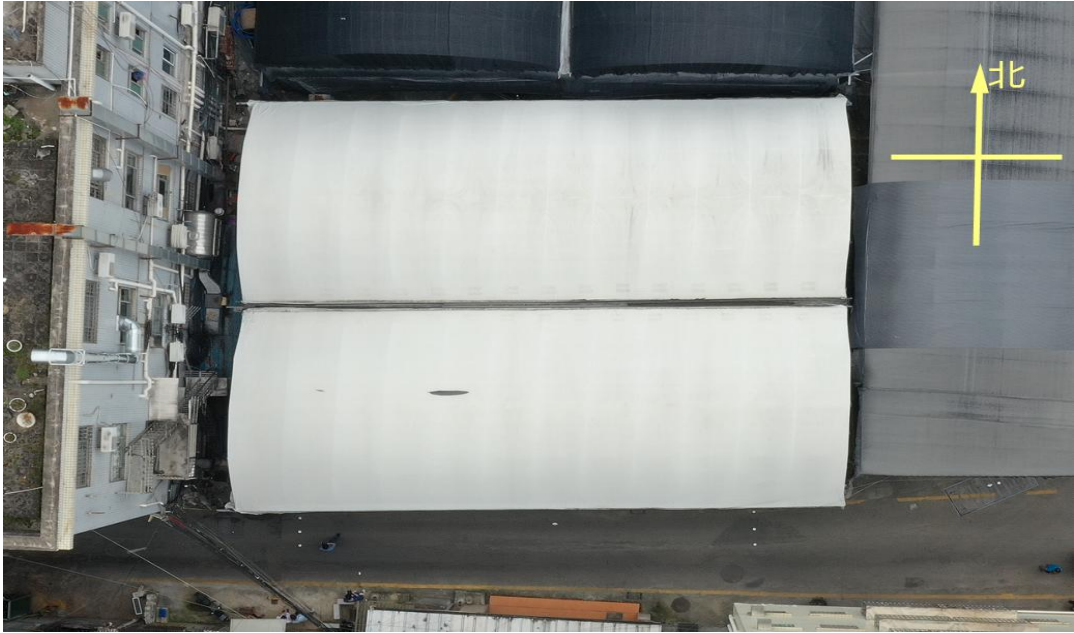
图 1 事发建筑俯视图