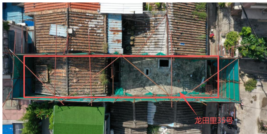
图 2 事发民房俯视图