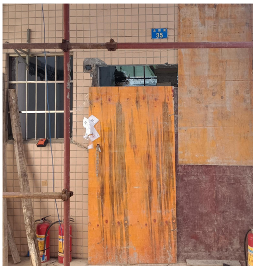
图 1 事发民房正门立面图

1. 勘察可见，龙田里 35 号自建房为一栋前厅后房、结构层数为两层、墙体为砖砌体、屋面为钢筋混凝土金字结构加盖复古瓦的砖混结构建筑物。该建筑物高度约为 6m、建筑物投影长度约为 14.6m、建筑物投影宽度约为 3.5m、总建筑面积约为 96 m 2 。