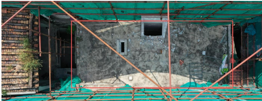
图4 民房屋面拆除情况

3. 勘察可见，后房阁楼与前厅屋面之间有一块横跨采光井的通道板，通道板边没有临边防护设施。